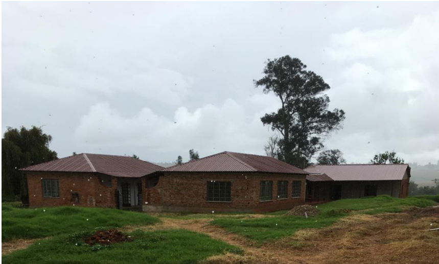
D.I.A. Dabaga Institute of Agriculture