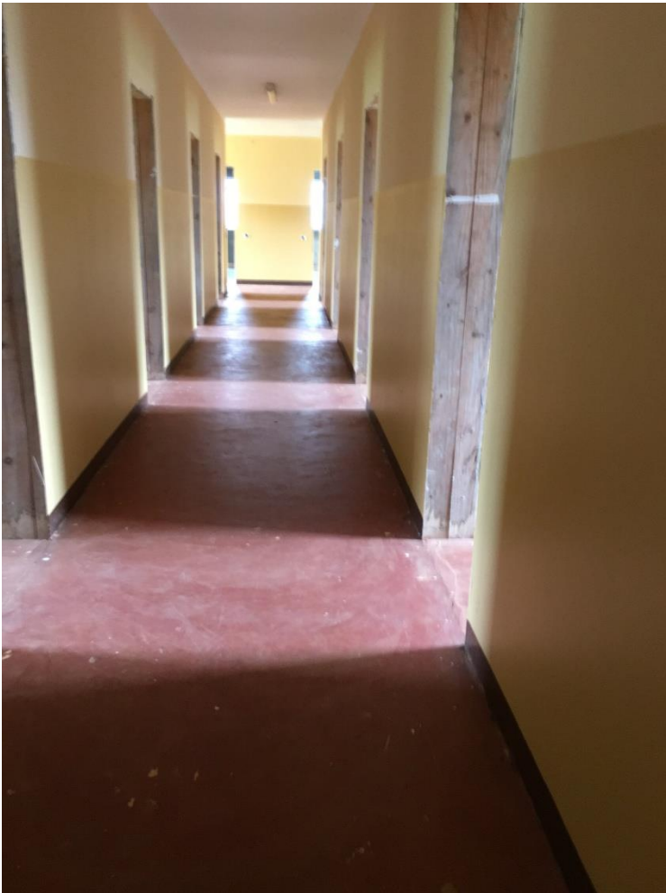
D.I.A. corridoio del convitto