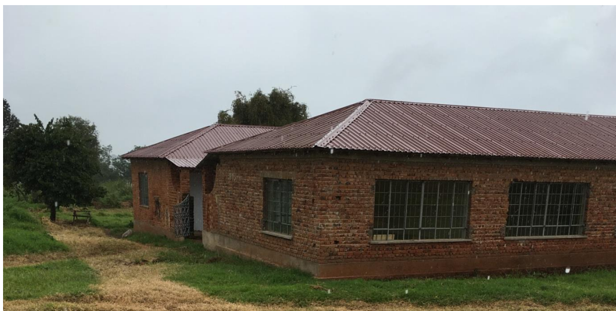
D.I.A. aula informatica, biblioteca. aule didattiche