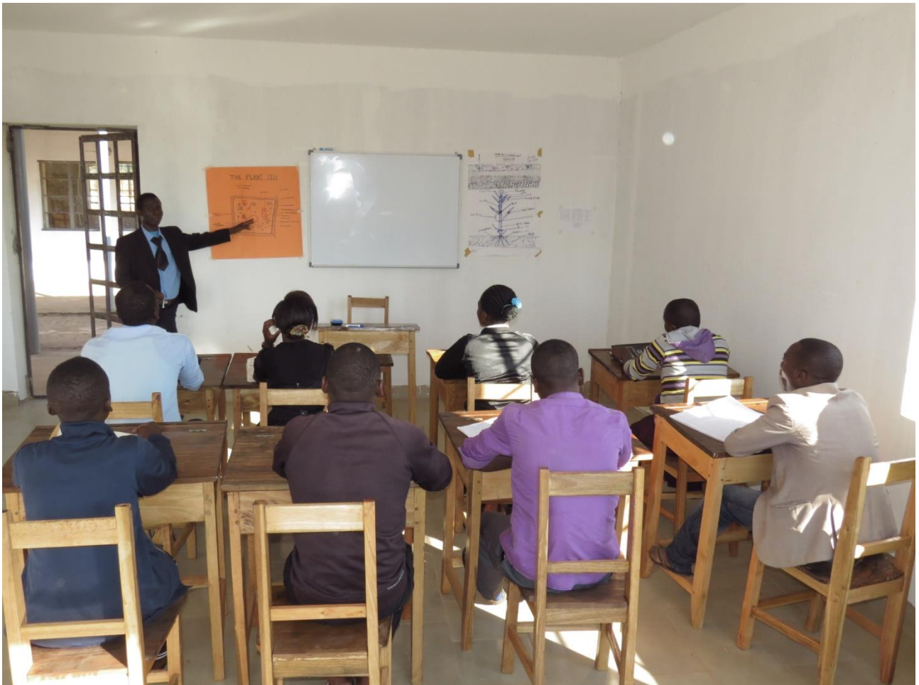
D.I.A. (Dabaga Institute of Agriculture), lezione in aula