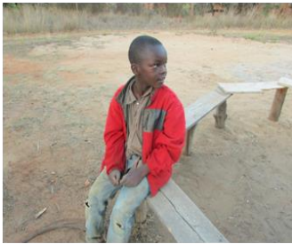
immagine utilizzata per volantini, iniziative, raccolta fondi, ecc