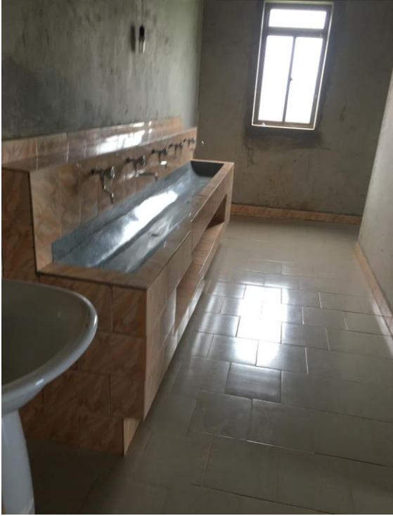
D.I.A. bagni convitto