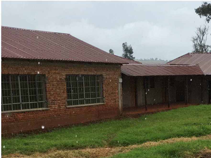
D.I.A. Portico ingresso presidenza e uffici amministrativi