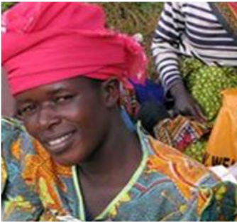
immagine simbolo utilizzata per volantini, iniziative, raccolta fondi, ecc

immagine utilizzata per volantini, iniziative, raccolta fondi, ecc